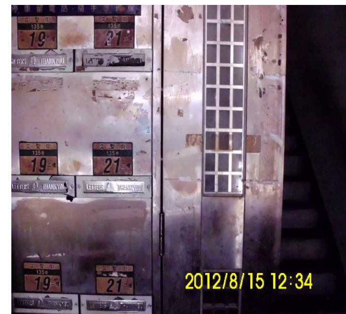
文聖街 135 巷 19-21 號