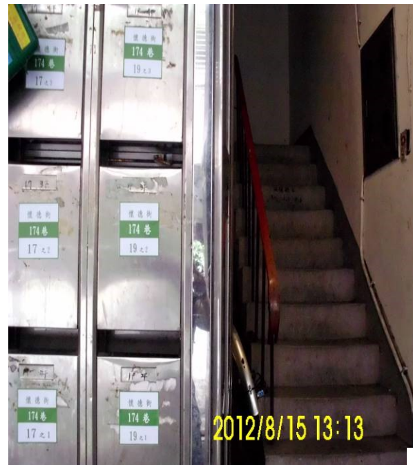
懷德街 174 巷 17-19 號