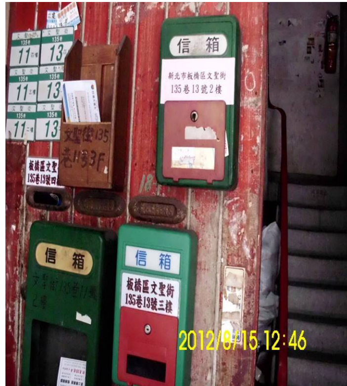
文聖街 135 巷 11-13 號