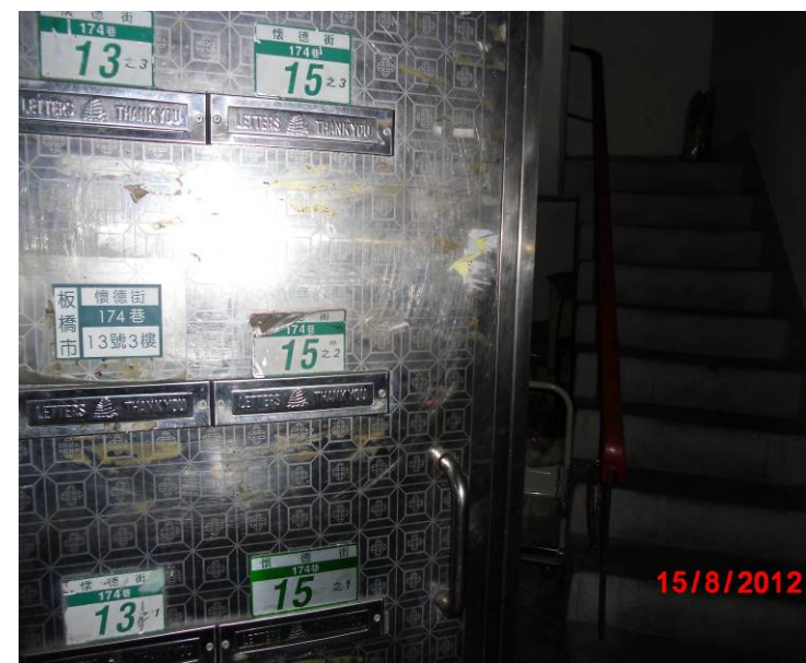
懷德街 174 巷 13-15 號