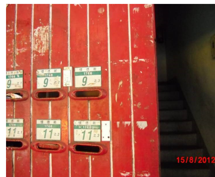
懷德街 174 巷 9-11 號