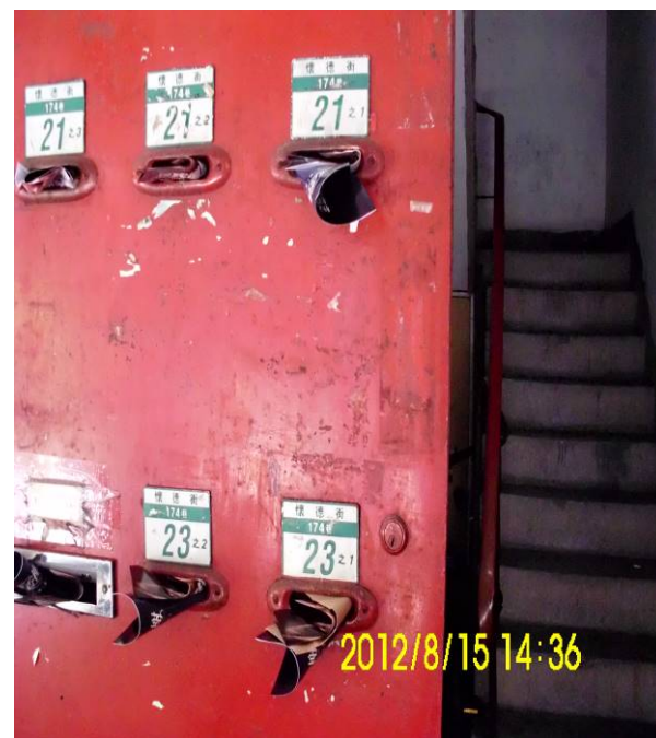
懷德街 174 巷 21-23 號