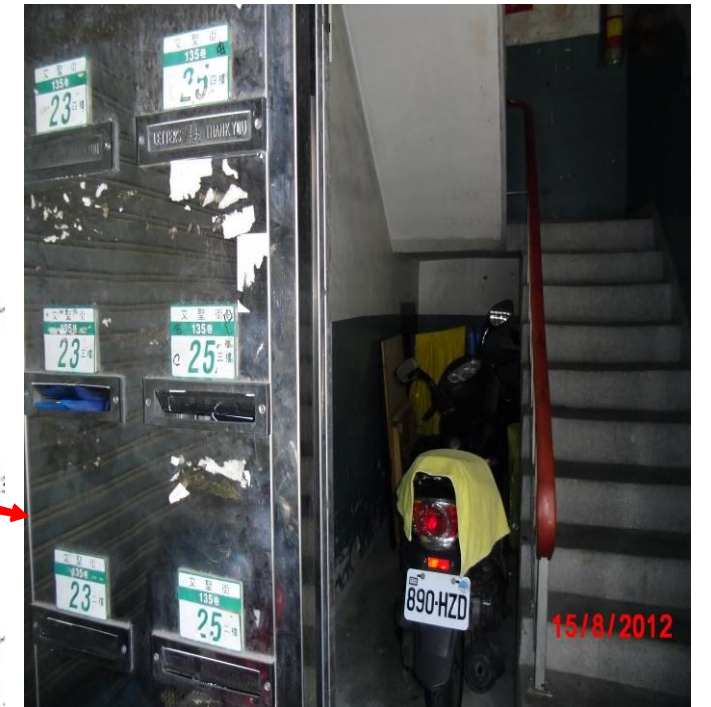
文聖街 135 巷 23-25 號