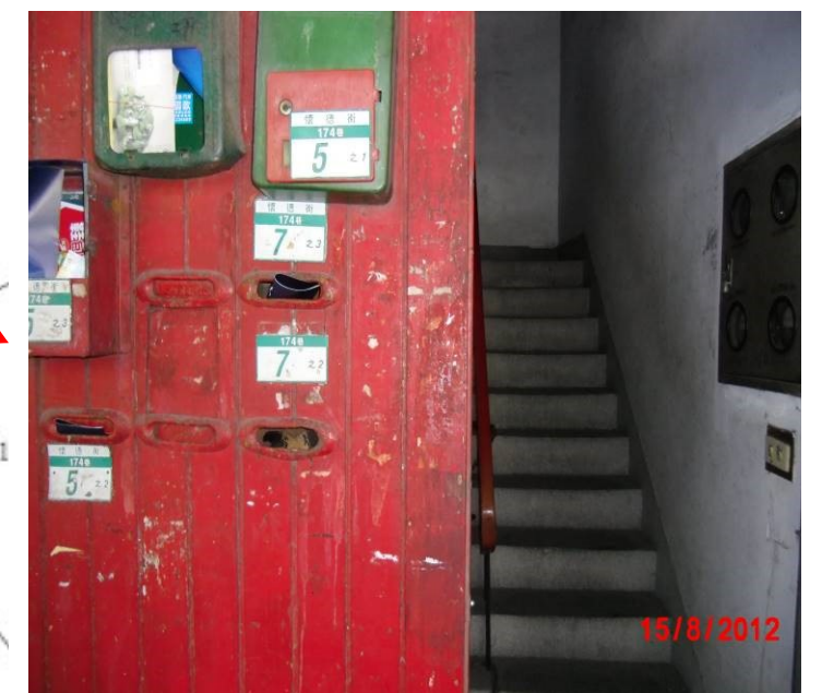
懷德街 174 巷 5-7 號