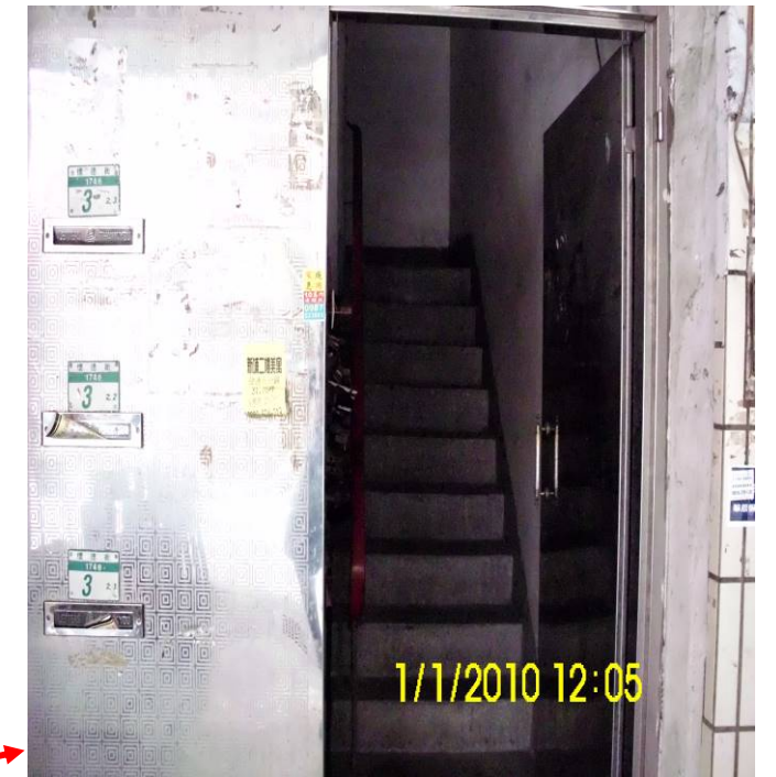
懷德街 174 巷 3 號